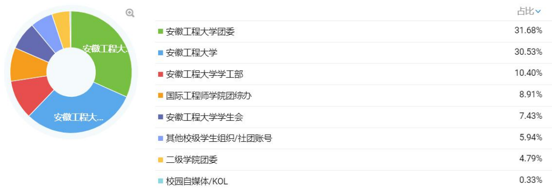
图 2 数据统计 2

本学年，团学综合办公室在国际工程师学院校区内累计开展或协助开展志愿服务活动 10 次、观影活动 11 次、公益讲座 3 次、调研活动 6 次、无偿献血活动 2 次、文艺表演 2 次、光盘行动 2 次、体育竞赛 1 次……活动类型覆盖“德育”“智育”“体育”“美育”“劳育”。