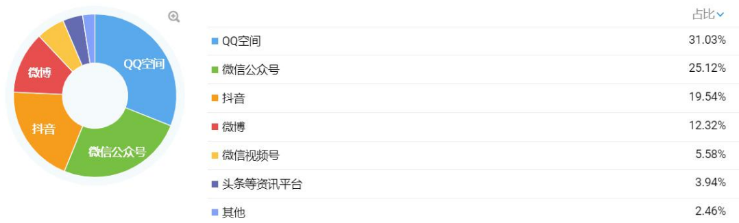
图 1 数据统计 1

在网络新媒体相关调研中，31.03%的同学更关注QQ空间，25.12%的同学更关注微信公众号，19.54%的同学更关注抖音平台。其中，大家更关注的账号有：@安徽工程大学团委 @安徽工程大学 @安徽工程大学学工部 @国际工程师学院团综办 等。