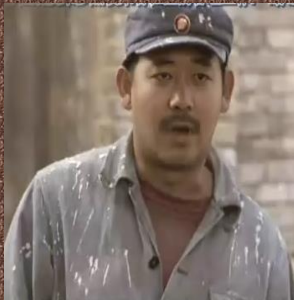
被水泥板夹死的二喜