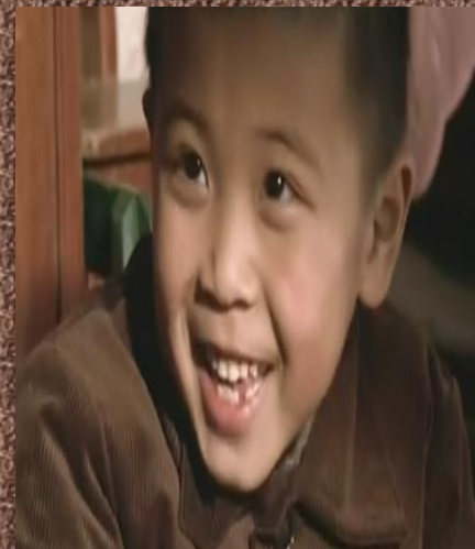
吃豆子噎死的苦根