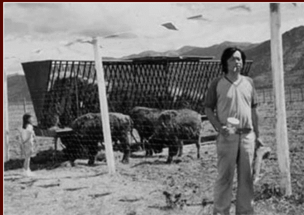
王小波 —— 苦难和荒谬所结晶出来的天才